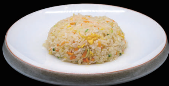
127 - RISO VERDURE € 6.00