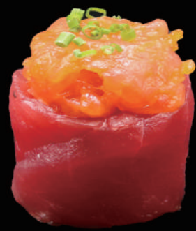
342 - GUNKAN TONNO € 7.00 allergeni: 4