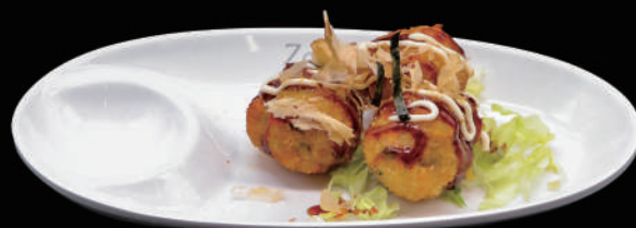
016 - TAKOYAKI 3PZ € 6.00 allergeni: 1