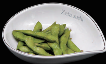
001 - EDAMAME € 5.00 allergeni: 6