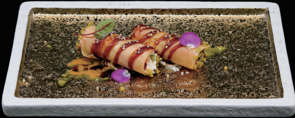
112 - CANNOLO SAKE 2PZ € 7.00 allergeni: 1, 4, 7, 8, 10, 11