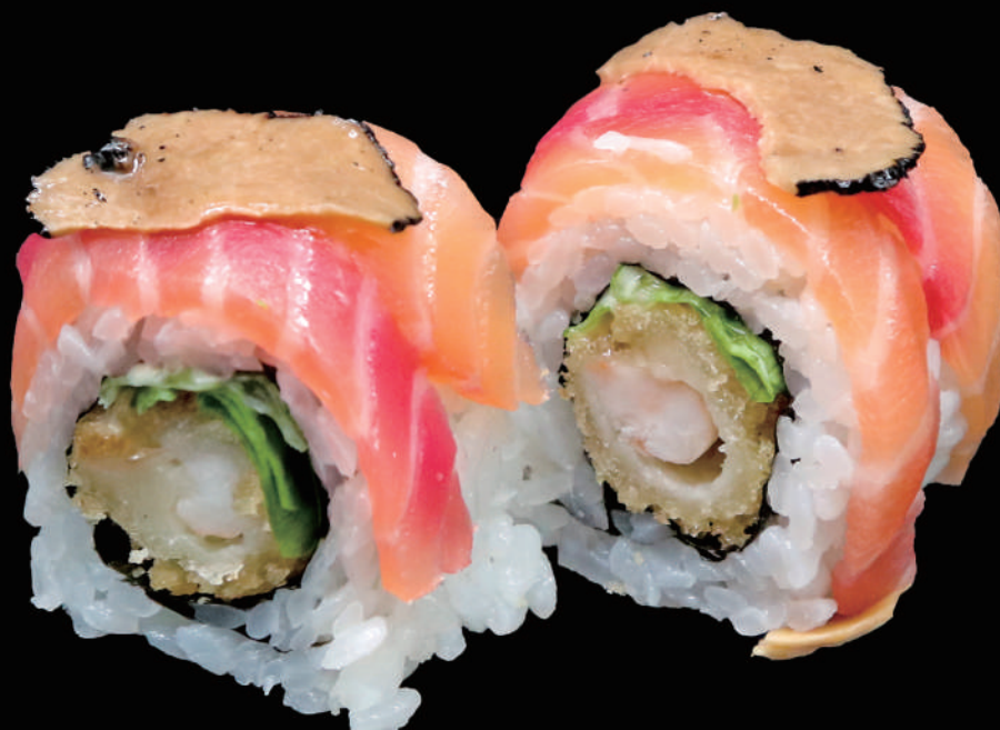
528 - URA. EBI FUME € 14.00 allergeni: 4, 6