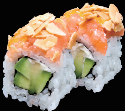
524 - URA. MANDORLE € 14.00 allergeni: 1, 4, 7