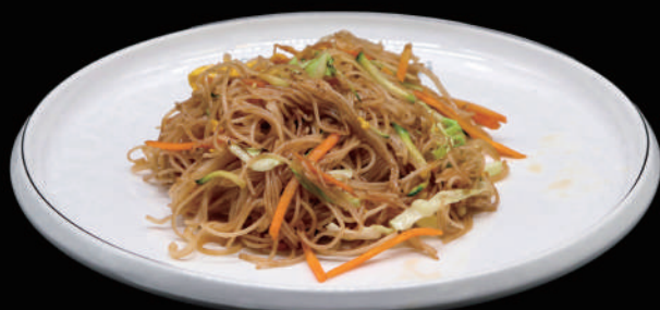
132 - SPAGHETTI DI RISO CON VERDURE € 6.00