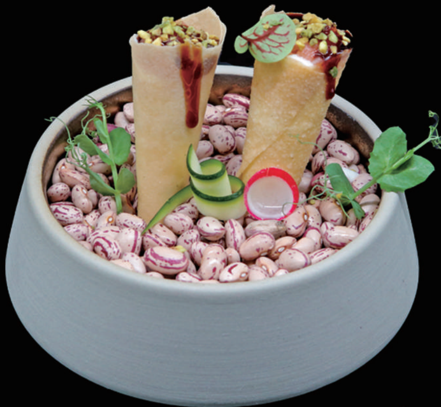
118 - CONO SAKE 2PZ € 8.00 allergeni: 1, 4, 6, 7