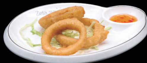
006 - ANELLI DI CIPOLLA 4PZ € 5.00 allergeni: 1