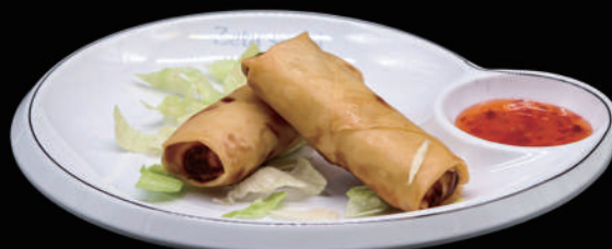
002 - INVOLTINO PRIMAVERA 2PZ € 4.00 allergeni: 1