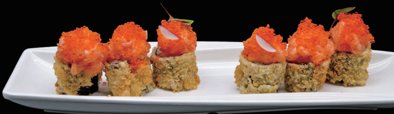
414 - FLY HOSO SPICY € 9.00 allergeni: 1, 4