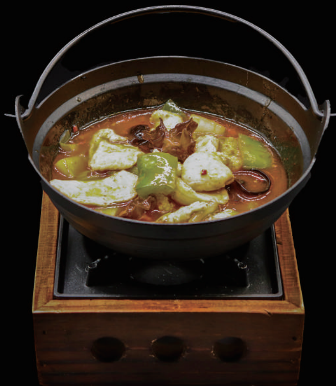
170 - KANCOO POLLO € 9.00 allergeni: 9