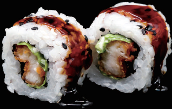
513 - URA. CHICKEN € 12.00 allergeni: 1, 11