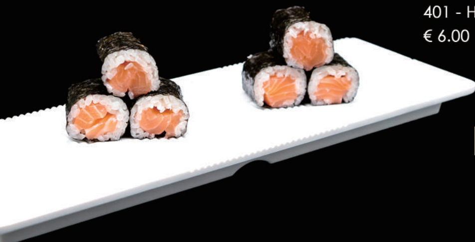
401 - HOSO SAKE € 6.00 allergeni: 4