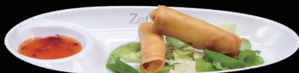
003 - HARUMAKI 3PZ € 5.00 allergeni: 1