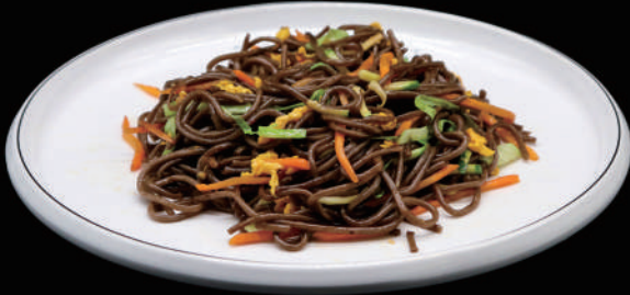
142 - SOBA VERDURE € 6.00