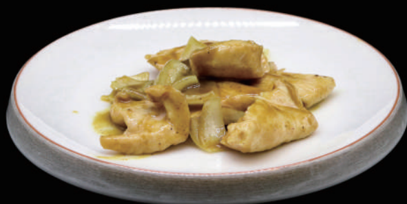
156 - POLLO AL CURRY € 7.00