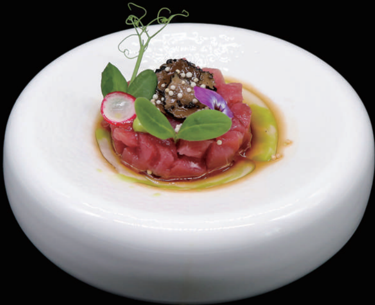
065.- TARTARE TUNA TRUFFLE € 12.00 allergeni: 4, 6