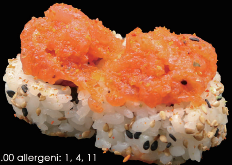
506 - URA. SPICY TUNA € 14.00 allergeni: 1, 4, 11