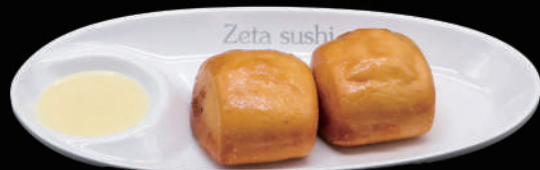
013 - PANE FRITTO 2PZ € 3.00 allergeni: 1