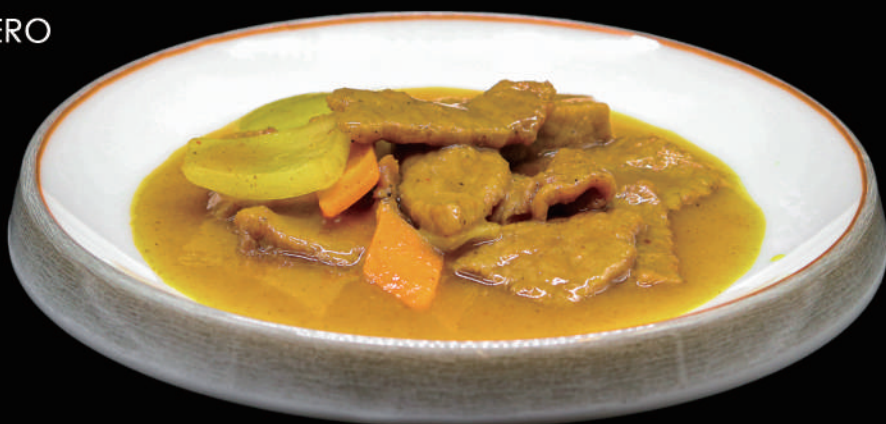
164 - MANZO AL CURRY € 7.00 allergeni: 2