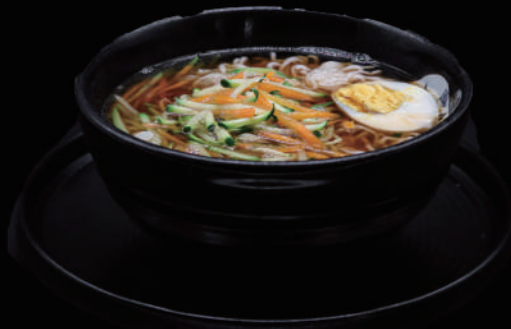
144 - RAMEN VERDURE € 8.00