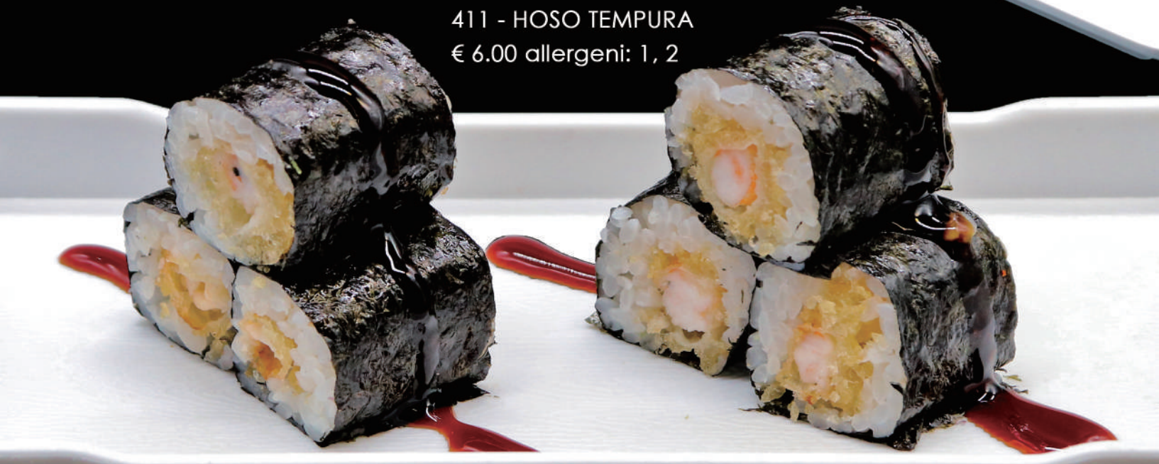
411 - HOSO TEMPURA € 6.00 allergeni: 1, 2