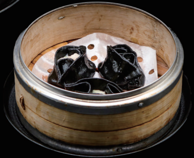
023 - DIM SUN CALAMARI 3PZ € 8.00