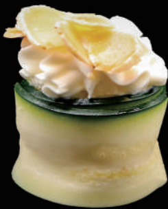
343 - GUNKAN ZUCCHINA € 5.00 allergeni: 1, 4, 6, 7