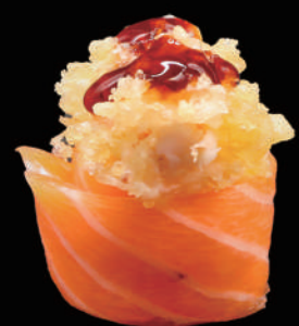
348 - GUNKAN TEMPURA € 5.00 allergeni: 1, 4