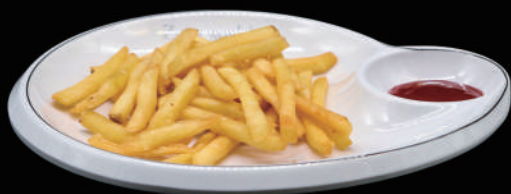
009 - PATATE FRITTE € 5.00 allergeni: 1