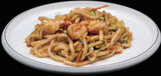
140 - UDON GAMBERI € 8.00 allergeni: 2