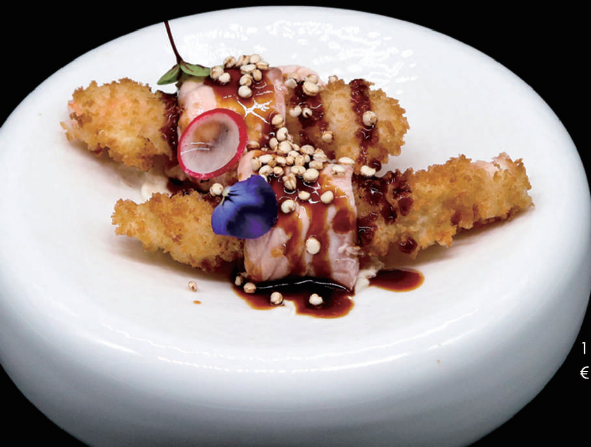
110 - EBI DIAMON ROLL € 7.00 allergeni: 2