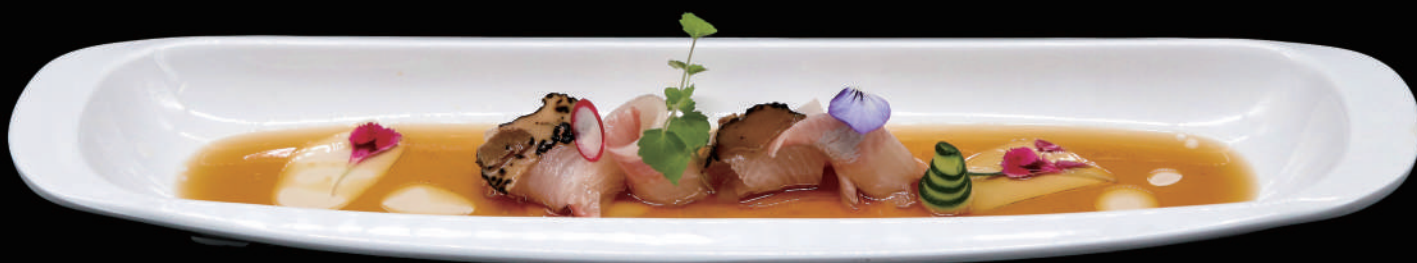
058 - CARPACCIO KANPACHI 4PZ € 12.00 allergeni: 4, 6