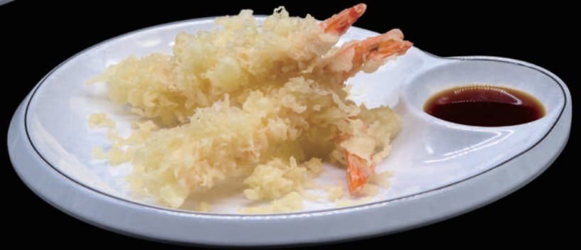
176 - EBI TEMPURA 5PZ € 9.00 allergeni: 1, 2