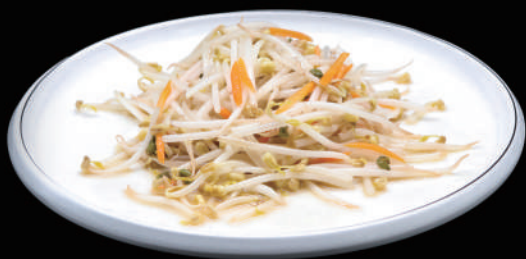
150 - GERMOGLI DI SOIA € 5.00