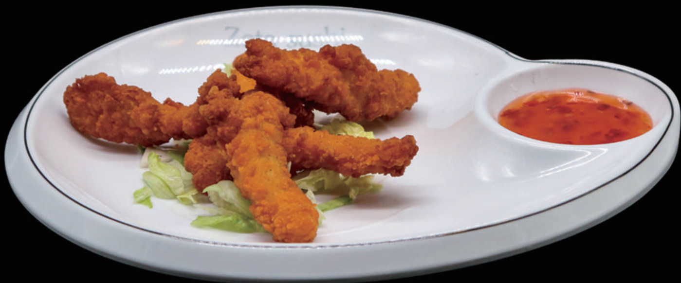
184 - POLLO FRITTO € 6.00 allergeni: 1