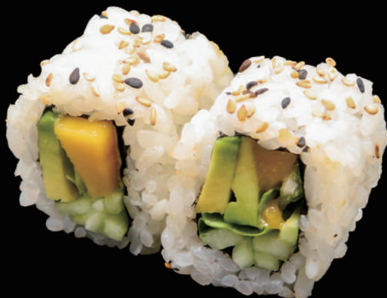
511 - URA. YASAI MANGO € 10.00 allergeni: 1, 10, 11