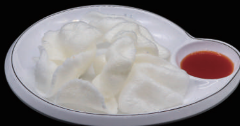
010 - NUVOLE DI DRAGO € 4.00