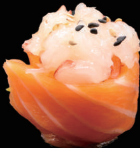
346 - GUNKAN ROSE € 6.00 allergeni: 1, 2, 4, 10