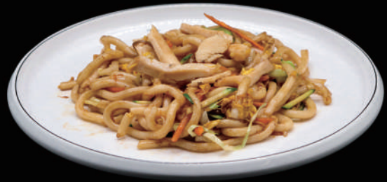
141 - UDON POLLO € 8.00