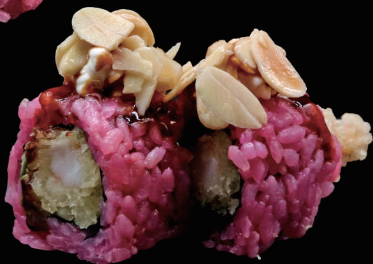
561 - ROSE TEMPURA € 14.00 allergeni: 2, 6