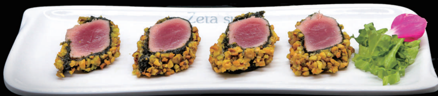
200 - MAGURO TATAKI SPECIAL 7PZ € 14.00