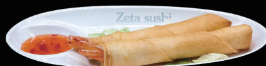
004 - EBI STICK 2PZ € 5.00 allergeni: 1