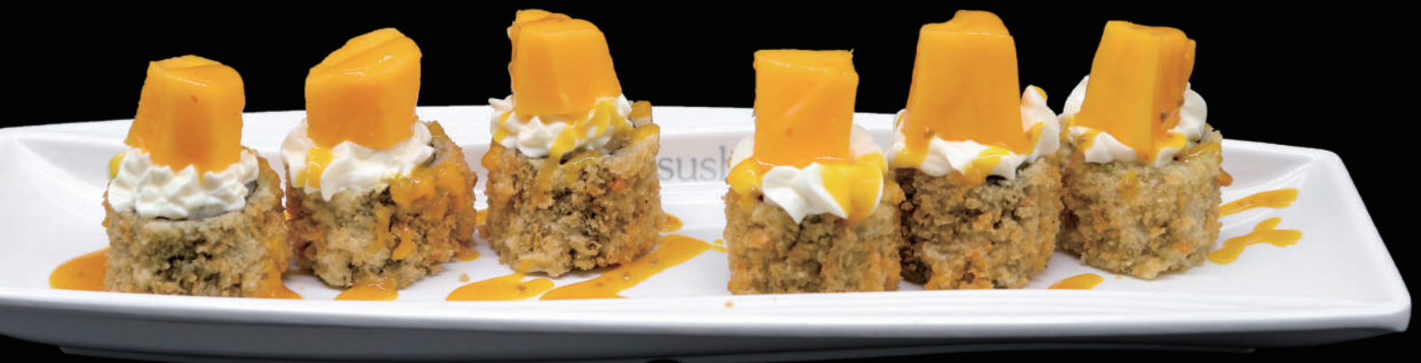
415 - FLY HOSO MANGO € 9.00 allergeni: 1, 6, 10