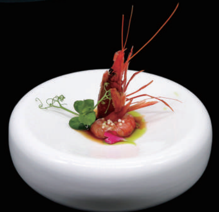
257 - SASHIMI GAMBERI ROSSO 2PZ € 8.00 allergeni: 2