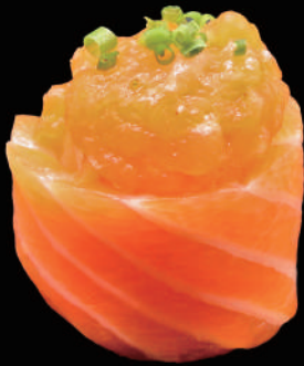
340 - GUNKAN SALMONE € 5.00 allergeni: 4