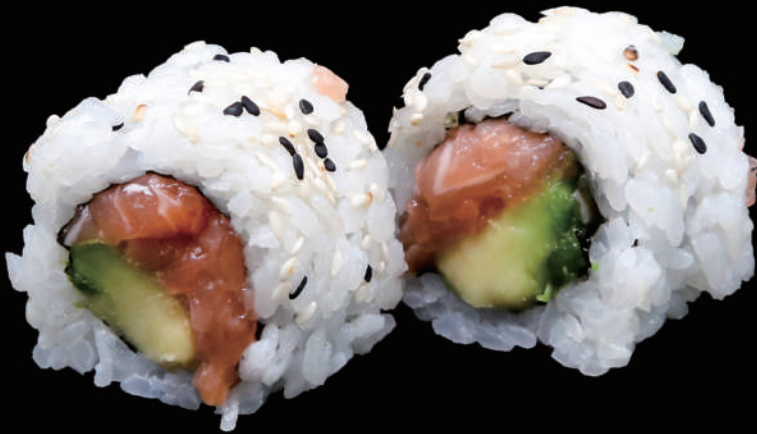
501 - URA. SAKE € 9.00 allergeni: 4, 11