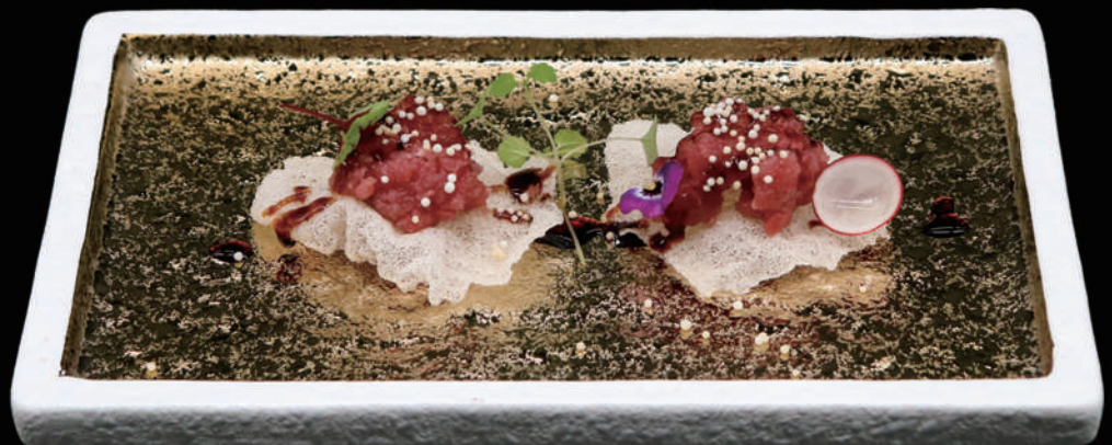
115 - CLOUD MAGURO 2PZ € 8.00 allergeni: 1, 2, 4, 6, 7