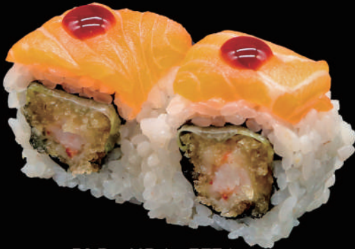
515 - URA. ZETA € 12.00 allergeni: 1, 2