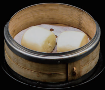
011 - PANE ORIENTALE 2PZ € 3.00