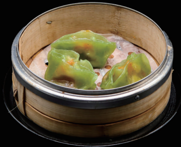
024 - DIM SUN VERDURE 3PZ € 8.00