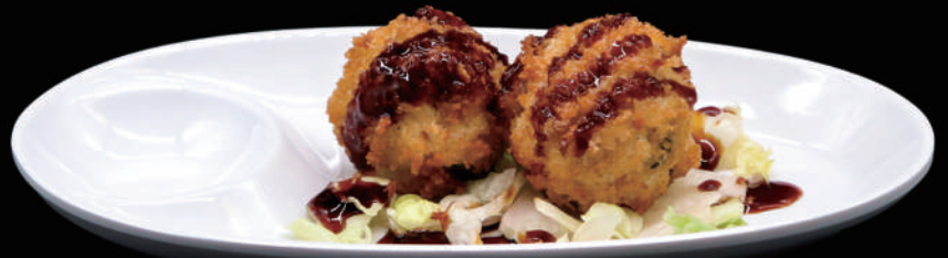
180 - SALMON KAROKKE 4PZ € 6.00 allergeni: 1