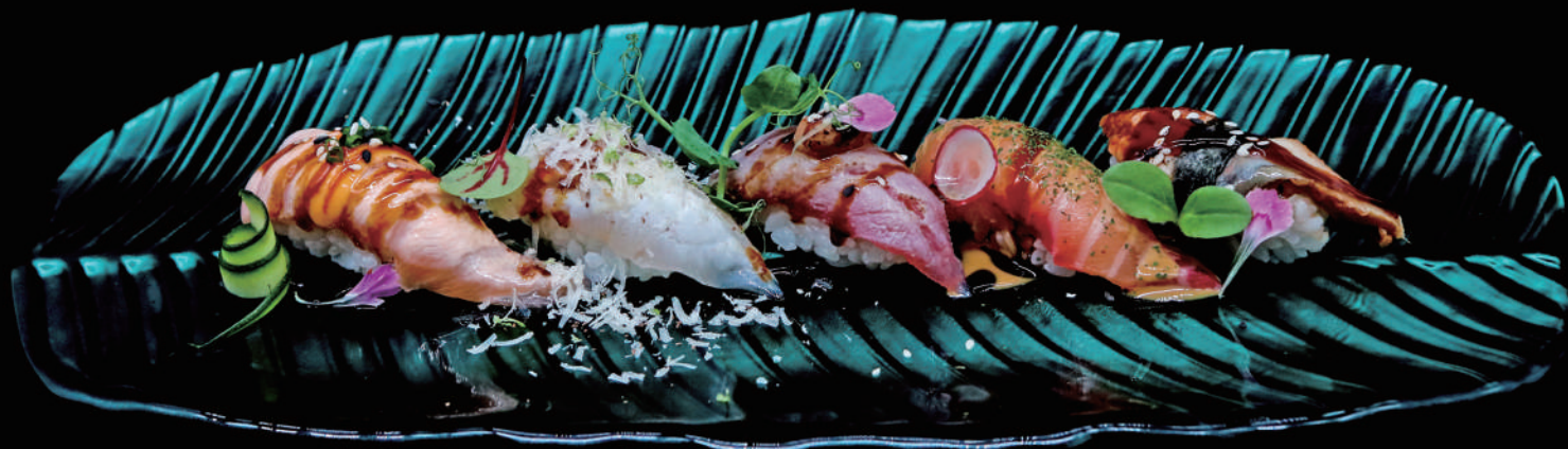
373 - N. MIX SPECIAL 5PZ € 10.00