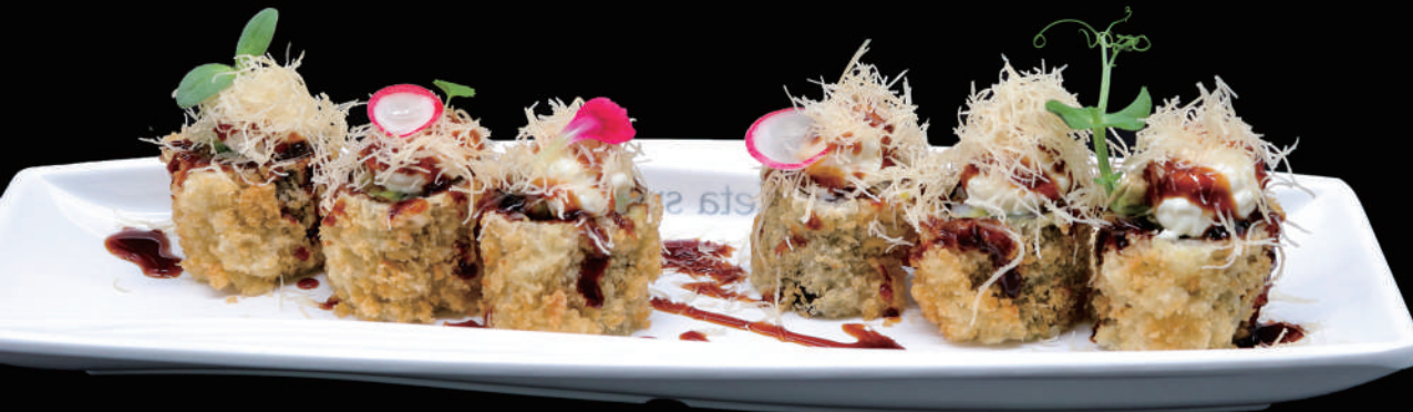
413 - FLY HOSO € 7.00 allergeni: 1, 6, 7