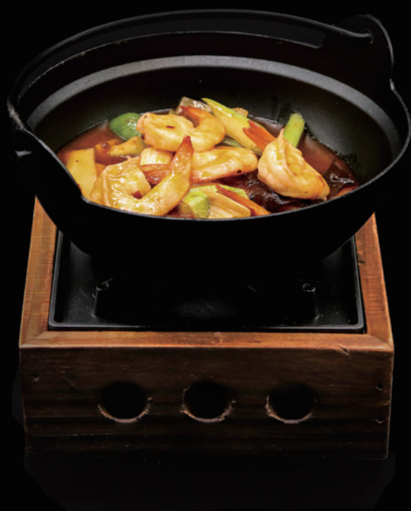
168 - KANCOO CON GAMBERI € 8.00 allergeni: 2, 9