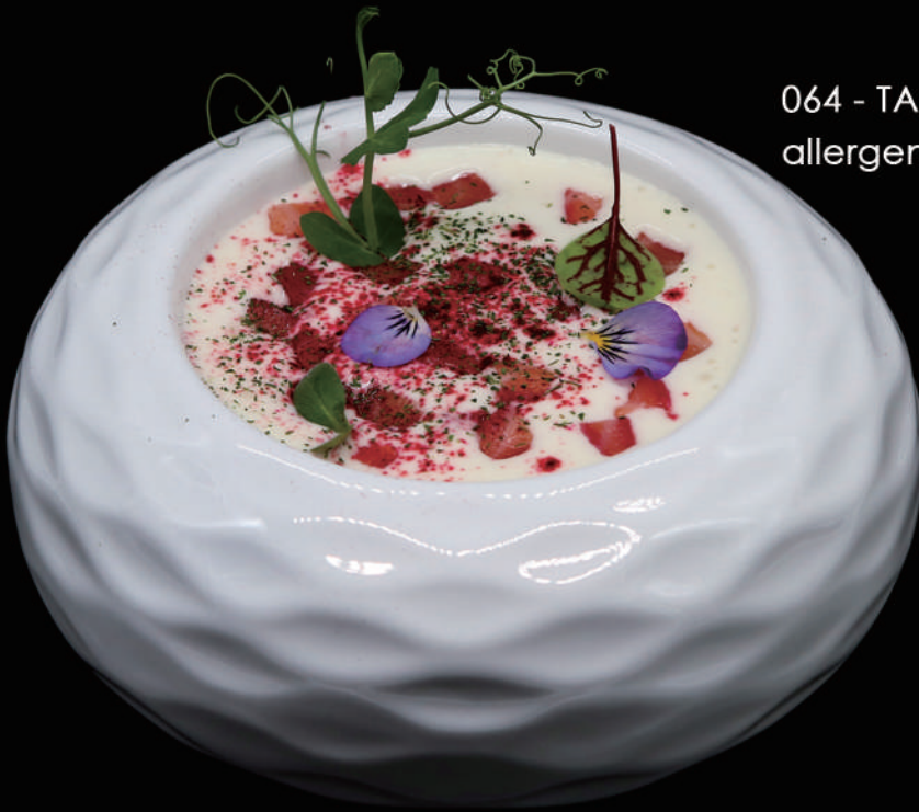
064 - TARTARE SALMON FUME € 12.00 allergeni: 4, 6, 7