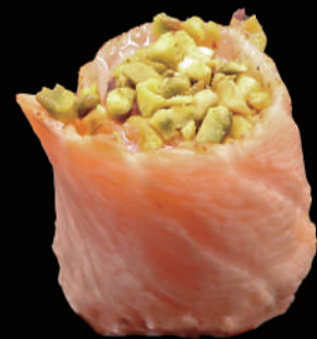
345 - GUNKAN FLAMBE € 6.00 allergeni: 1, 4, 8