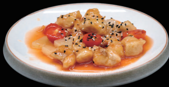
153 - POLLO AGRODOLCE € 6.00