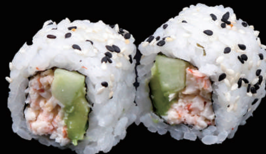
504 - URA. CALIFORNIA € 10.00 allergeni: 1, 2, 3