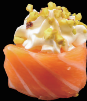
341 - GUNKAN PHILA € 5.00 allergeni: 4, 7