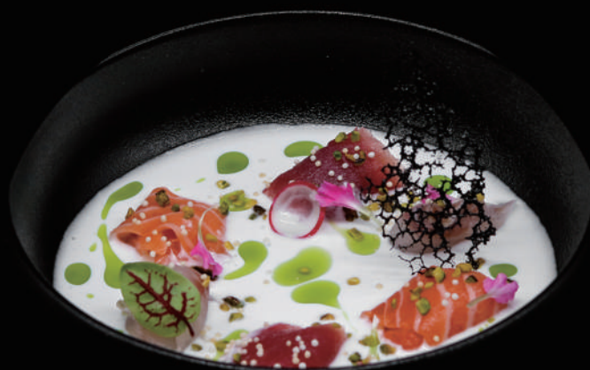
056.- CARPACCIO GOURMET 6PZ € 9.00 allergeni: 1, 4, 8