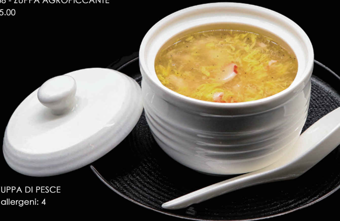
039 - ZUPPA DI PESCE € 6.00 allergeni: 4