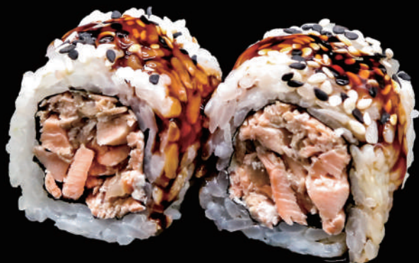
507 - URA. MIURA € 10.00 allergeni: 1, 4, 6, 7, 11