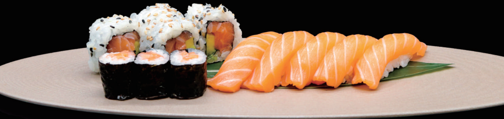
374 - SMALL SUSHI MAKI MIX 12PZ € 12.00