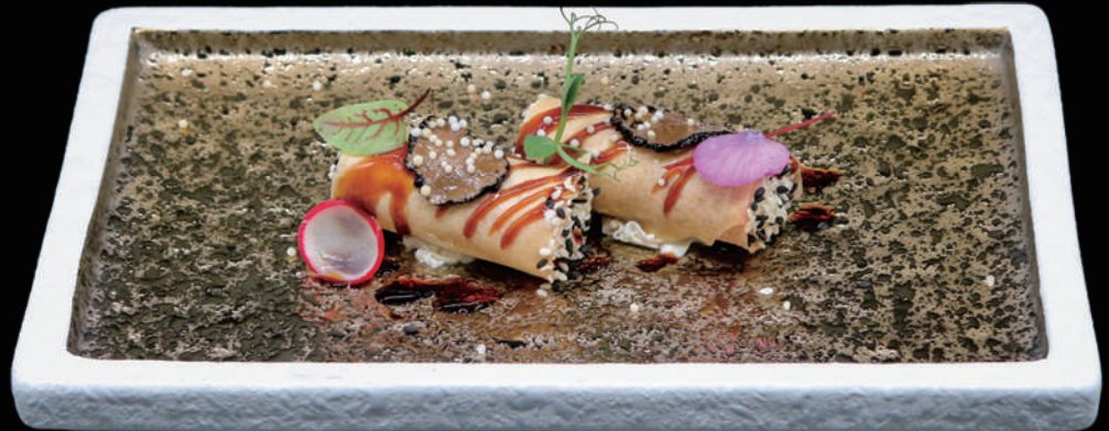
113 - CANNOLO MAGURO 2PZ € 8.00 allergeni: 1, 4, 6, 7