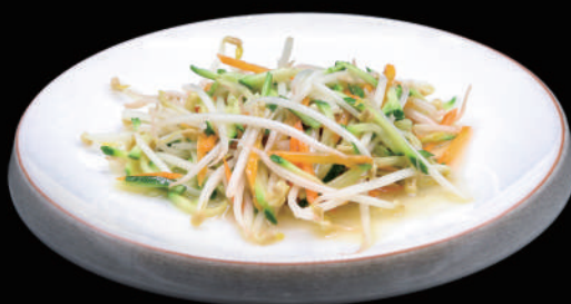
151 - VERDURE SALTATE € 5.00