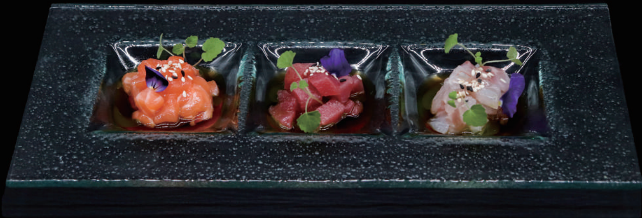
072 - TRIS TARTARE € 12.00 allergeni: 4, 6, 10