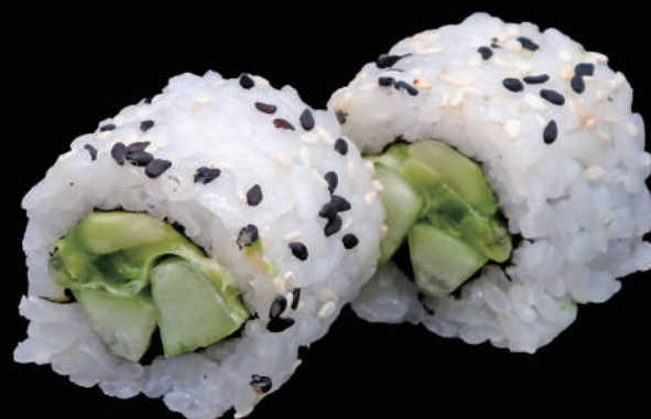
510 - URA. GREEN € 9.00