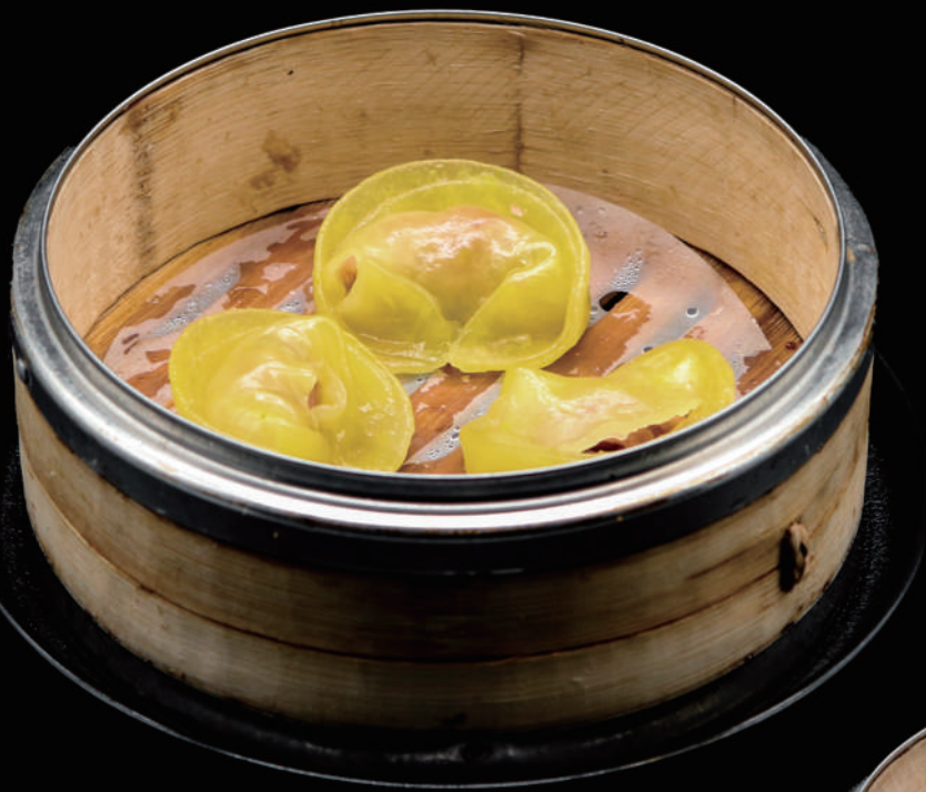
022 - DIM SUN TOTANO 3PZ € 8.00