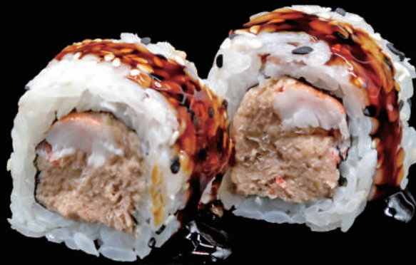
508 - URA. PACIFIC € 10.00 allergeni: 1, 4, 6, 11