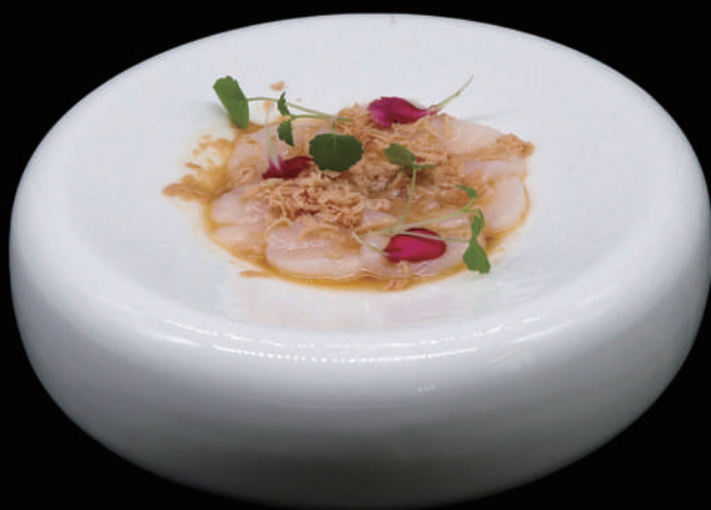
059.- CARPACCIO CAPESANTE 4PZ € 9.00 allergeni: 2