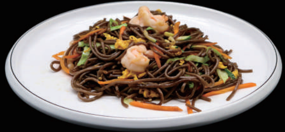
143 - SOBA GAMBERI € 8.00 allergeni: 2