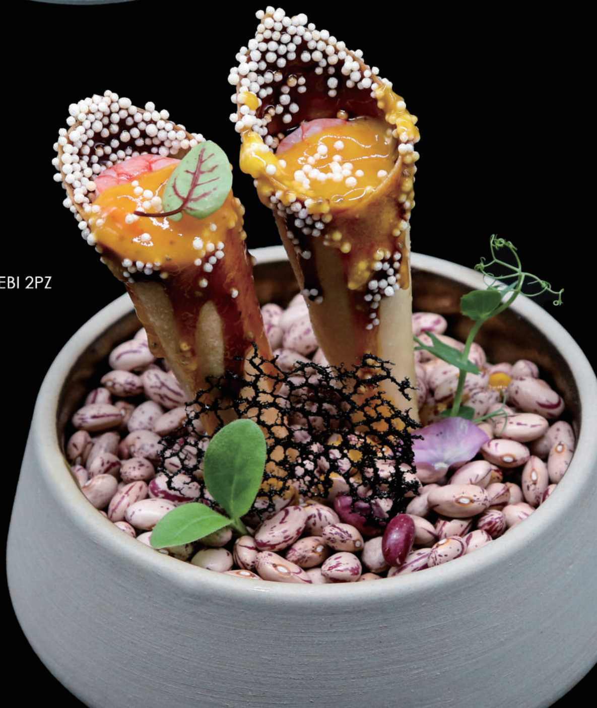
120 - CONO AMAEBI 2PZ € 8.00 allergeni: 1, 2