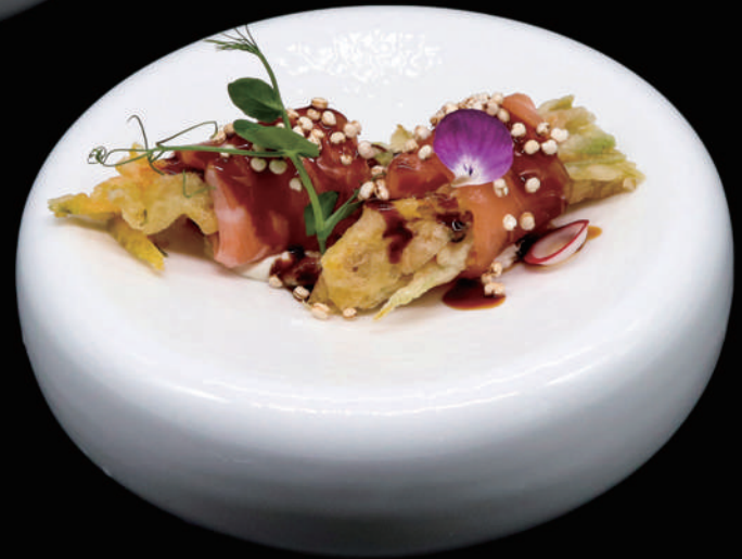
111 - FLOWER ROLL € 8.00 allergeni: 2