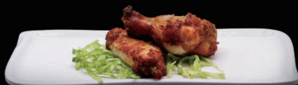
005 - ALETTE DI POLLO 3PZ € 6.00 allergeni: 1