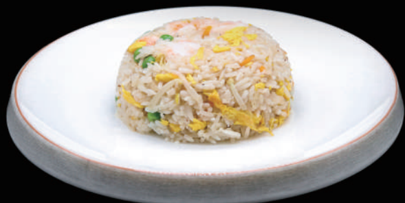
131 - ZETA DON € 8.00 allergeni: 2