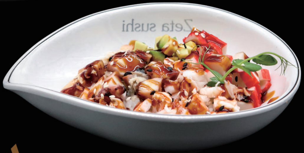
581 - POKE COTTO € 11.00 allergeni: 1, 2