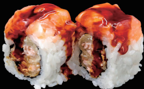
526 - URA. GOLDEN € 12.00 allergeni: 4