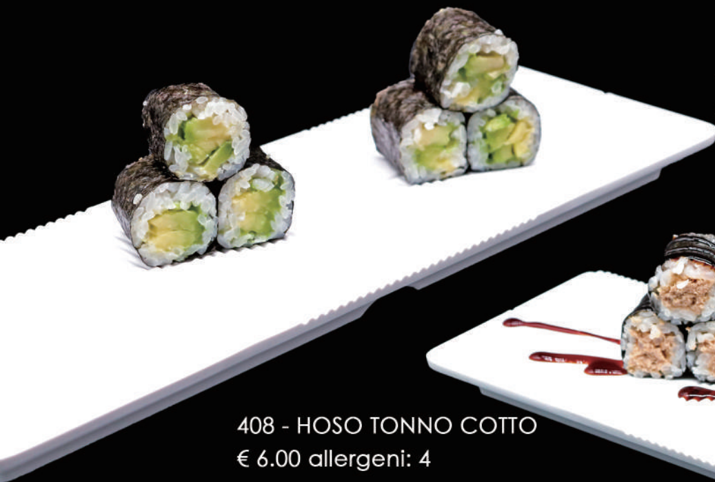
407 - HOSO AVOCADO € 5.00