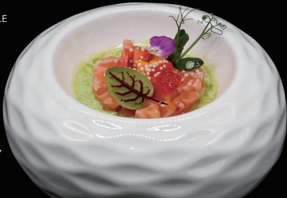
067.- TARTARE GOURMET € 10.00 allergeni: 1, 4, 6, 7