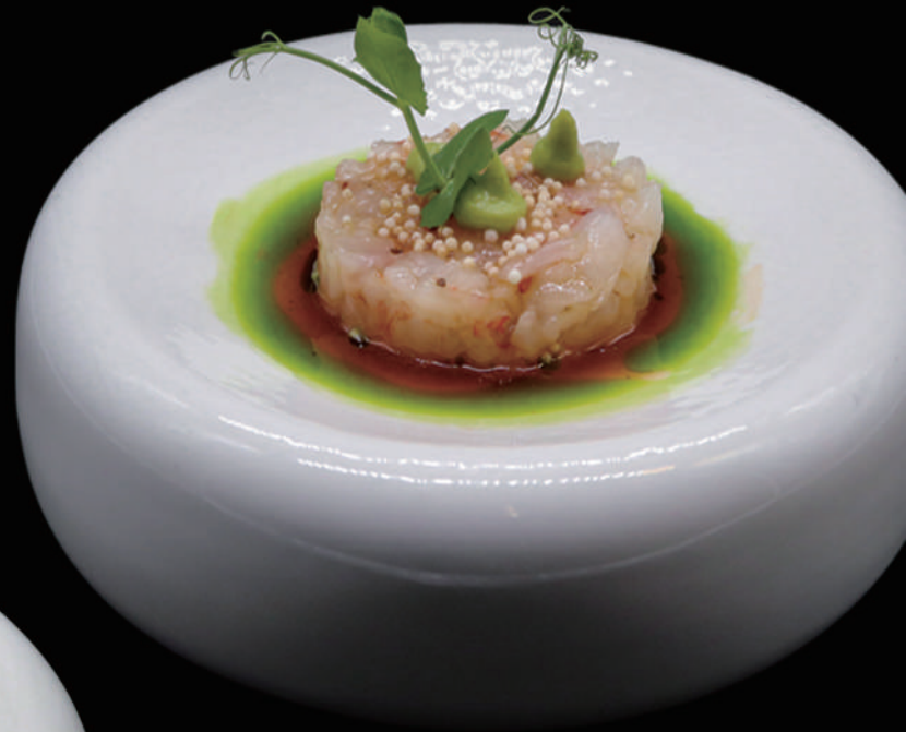
069 - TARTARE AMAEBI € 12.00 allergeni: 2, 6, 10, 11