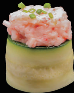
344 - GUNKAN GAMBERI COTTI € 6.00 allergeni: 1, 2, 3, 4