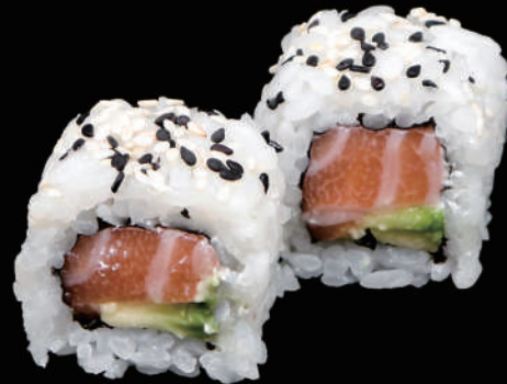
502 - URA. PHILADELPHIA € 10.00 allergeni: 4, 7, 11