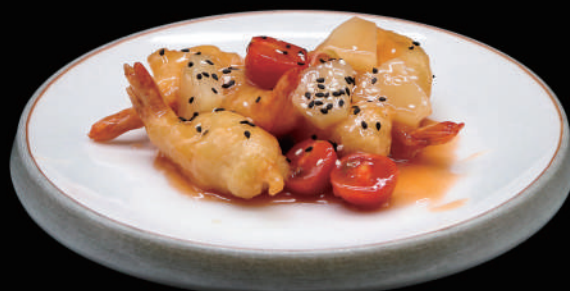
157 - GAMBERI AGRODOLCE € 7.00 allergeni: 2