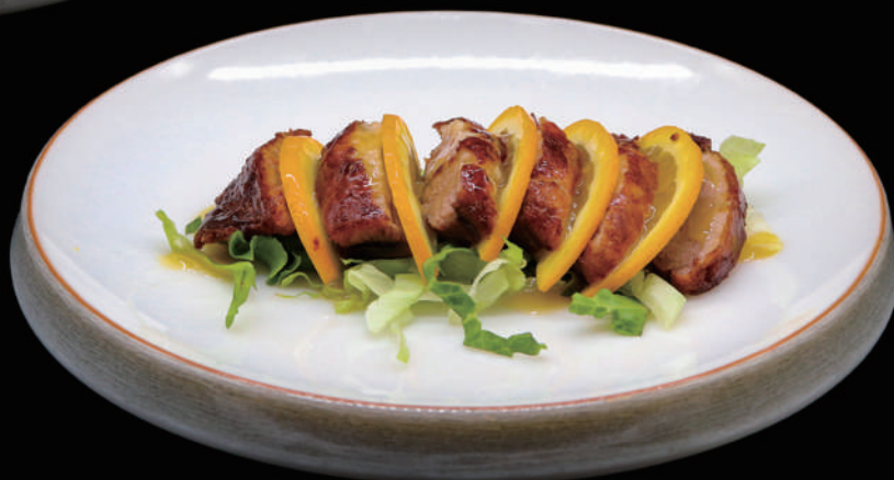
166 - ANATRA ALL'ARANCIA € 7.00 allergeni: 2