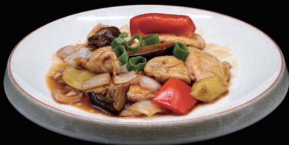
154 - POLLO ALLO ZENZERO € 6.00