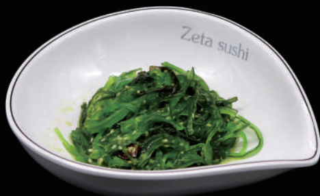
015 - GOMAWAKAME € 5.00