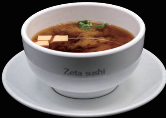
036 - MISO SHIRU € 4.00