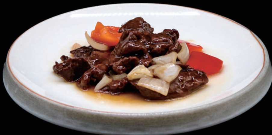
163 - MANZO AL PEPE NERO € 7.00 allergeni: 2