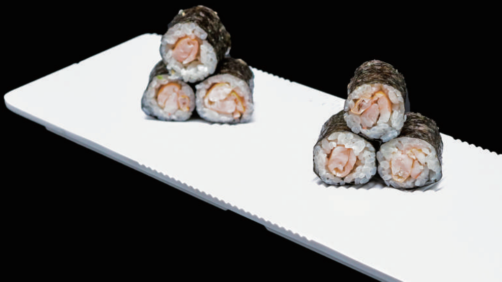
406 - HOSO EBI € 6.00 allergeni: 2