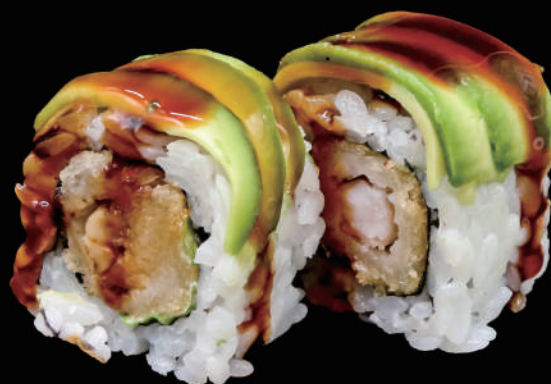
527 - URA. DRAGON € 14.00 allergeni: 1, 2, 3, 4, 6, 11