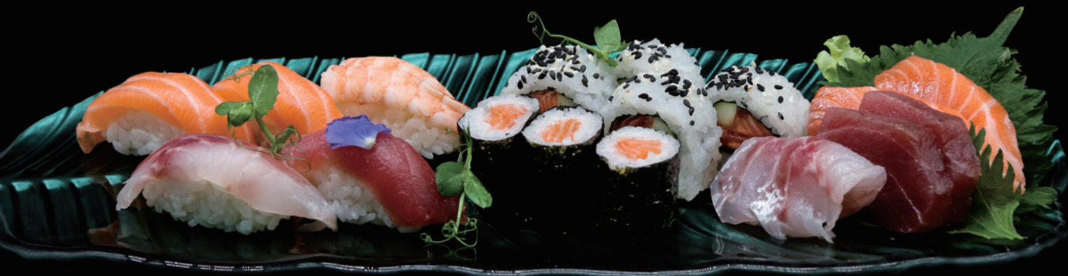
375 - SUSHI SASHIMI MIX 18PZ € 24.00