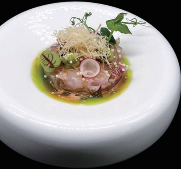
068 - TARTARE BRANZINO € 9.00 allergeni: 4