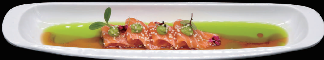
057 - CARPACCIO SALMONE 4PZ € 7.00 allergeni: 4, 6, 11