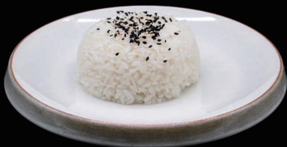
125 - GOHAN € 3.50