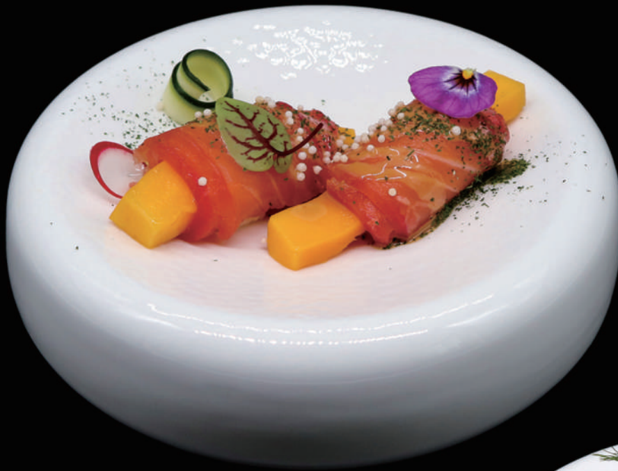
109 - AFFUMICATO ROLL € 8.00