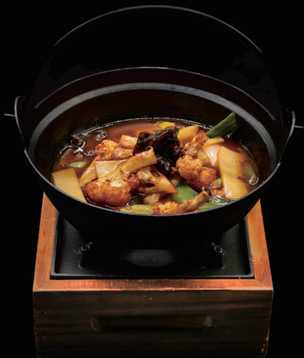
167 - KANCOO CON CAVOLFIORE € 7.00 allergeni: 9