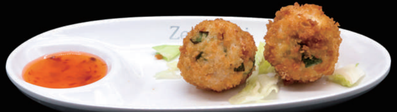
178.- CHICKEN KAROKKE 4PZ € 6.00 allergeni: 1