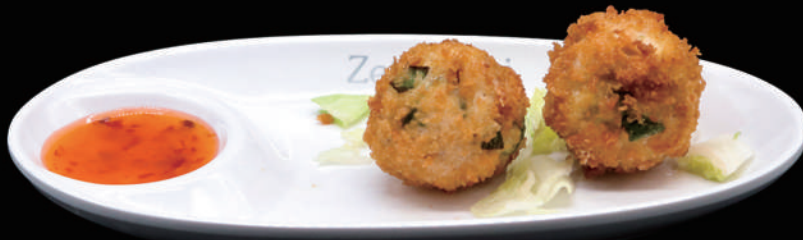
179 - EBI KAROKKE 4PZ € 6.00 allergeni: 1, 2