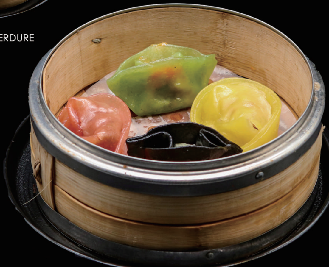
025 - DIM SUN MIX 4PZ € 10.00