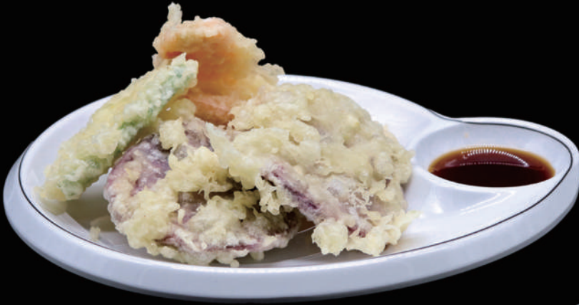
175 - YASAI TEMPURA 6PZ € 8.00 allergeni: 1