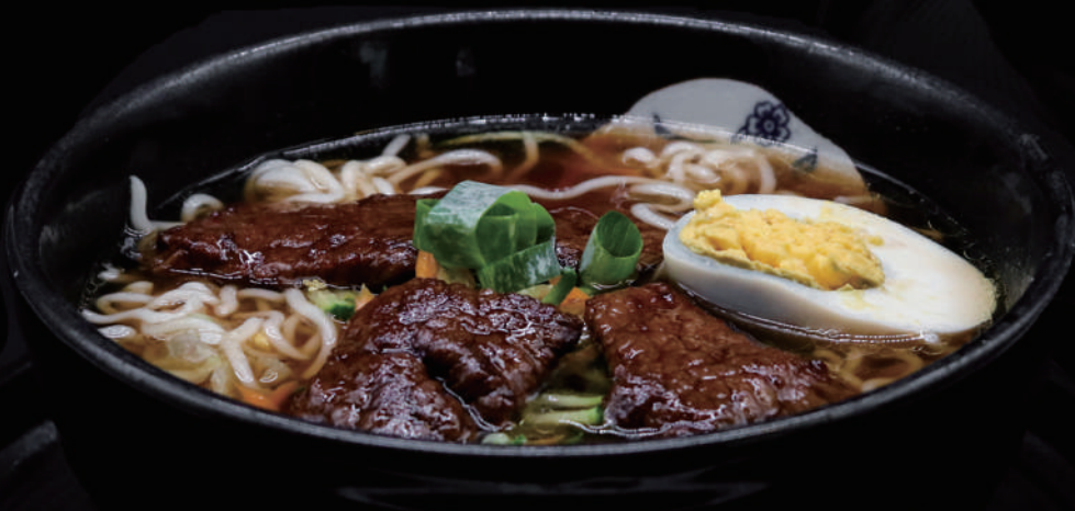
146 - RAMEN MANZO € 9.00 allergeni: 4