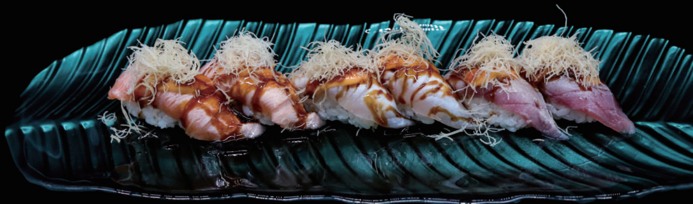
372 - NIGIRI FLAMBE MIX 6PZ € 9.00