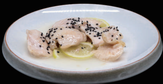
152 - POLLO AL LIMONE € 6.00