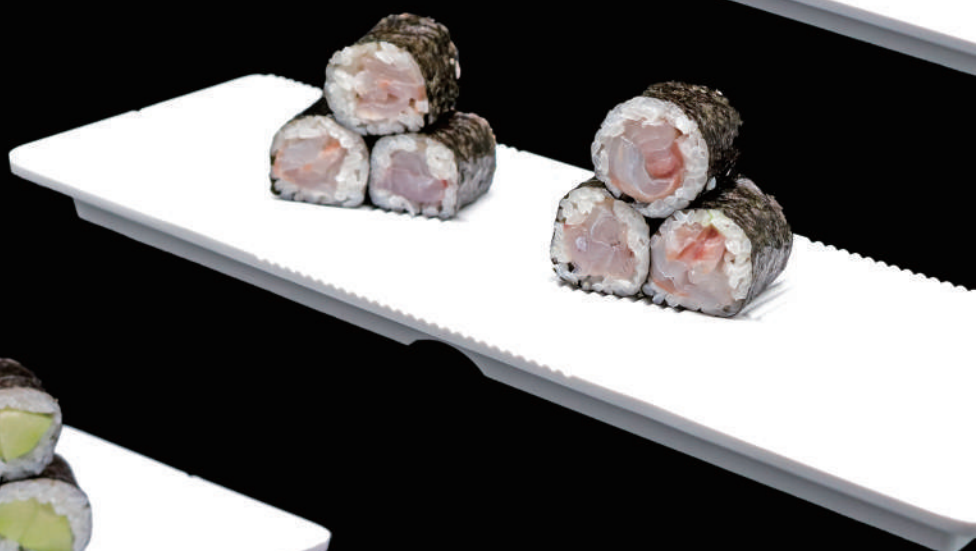
403 - HOSO SUZUKI € 6.00 allergeni: 4