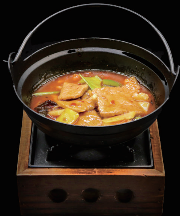
169 - KANCOO CON MANZO € 8.00 allergeni: 9