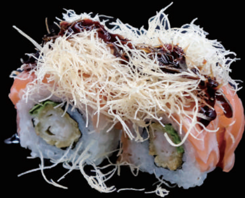
516 - URA. TIGER € 14.00 allergeni: 1, 2, 4