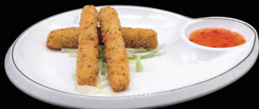
007 - MOZARELLA STICK 4PZ € 6.00 allergeni: 1