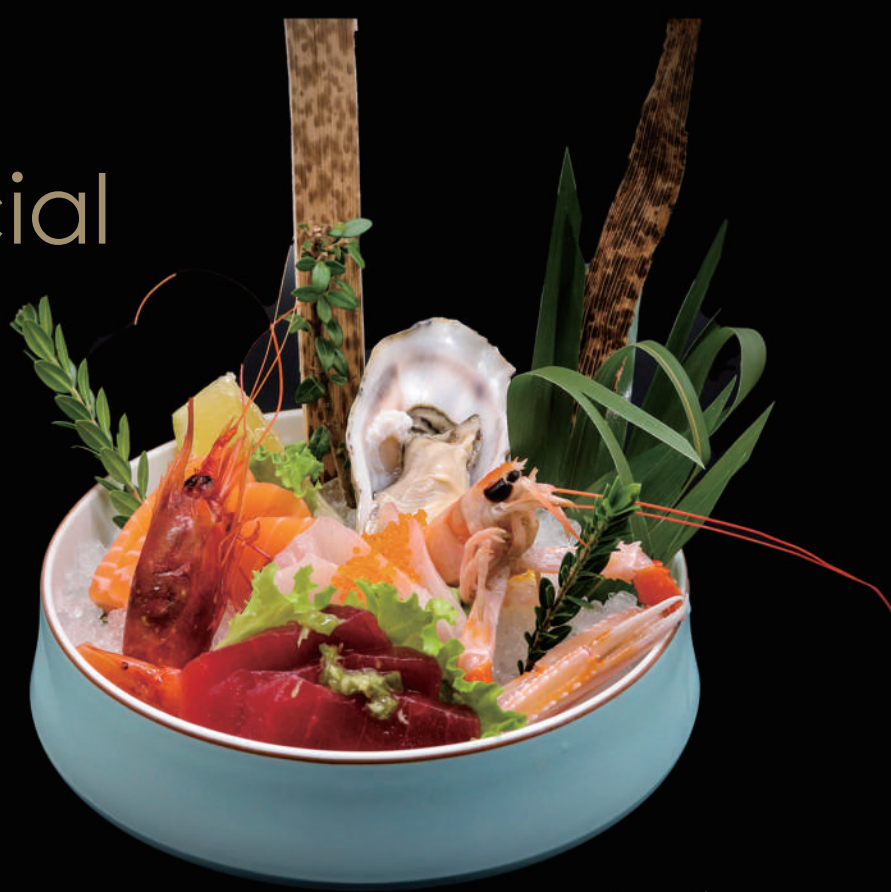
254 - SASHIMI SPECIALE 14PZ € 22.00 allergeni: 2, 4