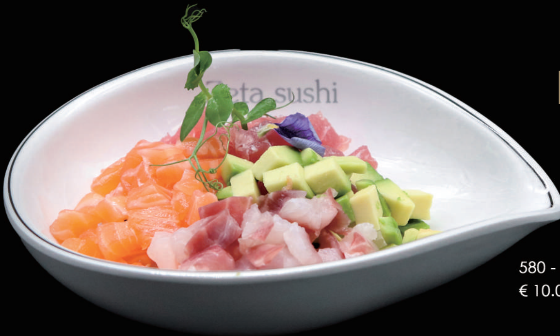
580 - POKE CRUDO € 10.00 allergeni: 1