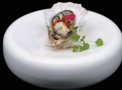
255 - SASHIMI SCAMPO 2PZ € 8.00 allergeni: 2