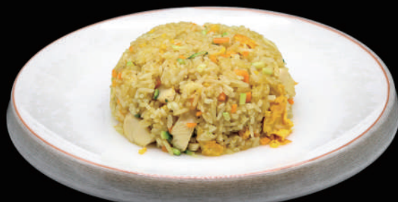
130 - RISO AL CURRY € 7.00