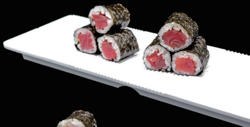
402 - HOSO MAGURO € 7.00 allergeni: 4