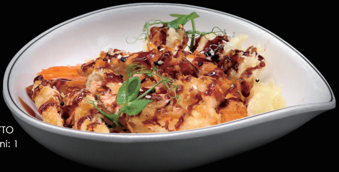
583 - POKE FRITTO € 11.00 allergeni: 1