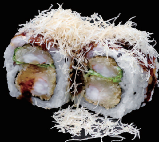
512 - URA. EBITEN € 12.00 allergeni: 1, 2, 11