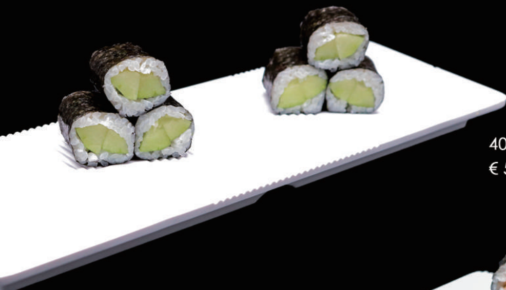
404 - HOSO KAPPA € 5.00