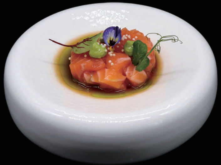
066 - TARTARE SALMONE € 7.00 allergeni: 4, 6