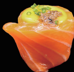
347 - GUNKAN EGG € 7.00 allergeni: 3, 4