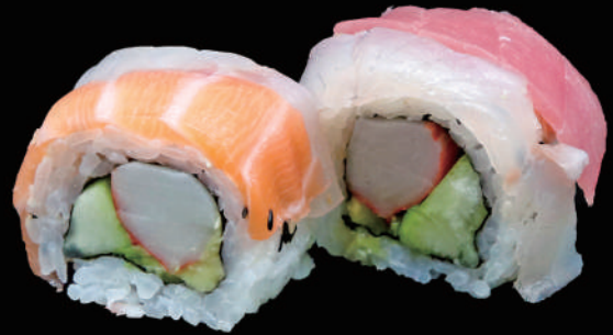
514 - URA. RAINBOW € 14.00 allergeni: 4