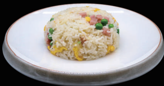
126 - RISO CANTONESE € 6.00