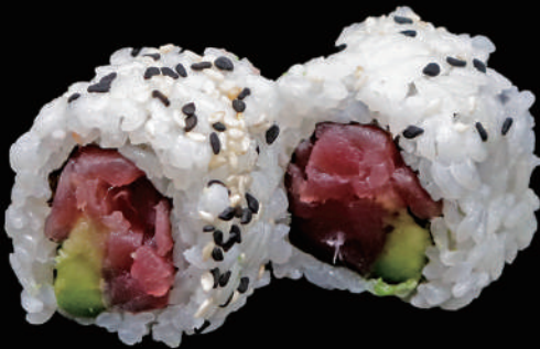
503 - URA. MAGURO € 12.00 allergeni: 4, 11