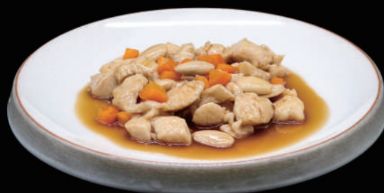
155 - POLLO MANDORLE € 7.00