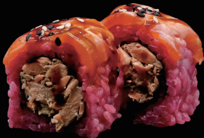
562 - ROSE MIURA PLUS € 14.00