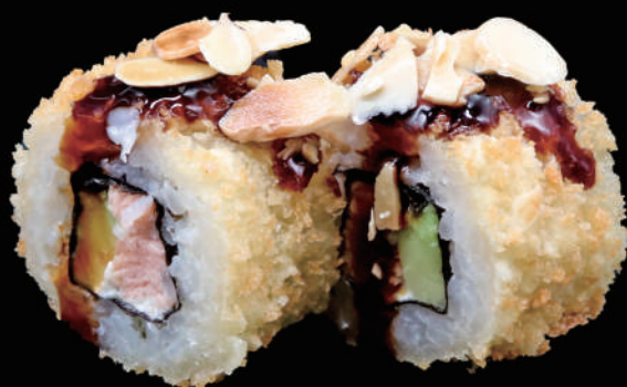
509 - URA. FRY PHILA € 12.00 allergeni: 1