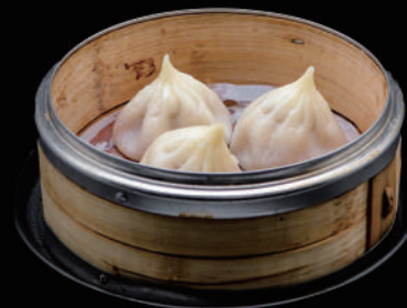
014 - BAOZI 3PZ € 4.00