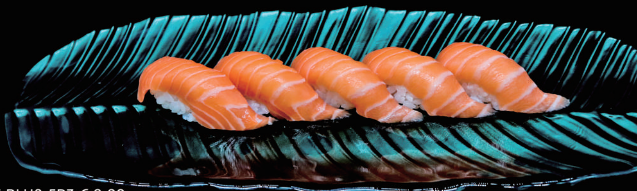
370 - SAKE PLUS 5PZ € 8.00