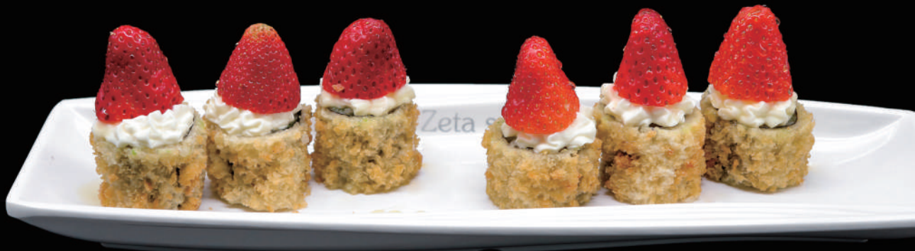
412 - FLY HOSO STRAWBERRY € 9.00 allergeni: 1, 6, 7