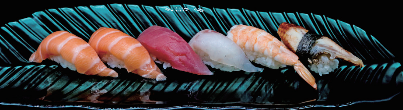
371 - NIGIRI MIX 6PZ € 9.00