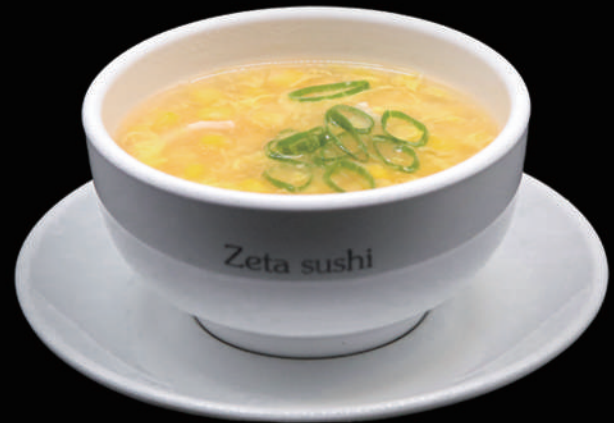
037 - ZUPPA DI POLLO E MAIS € 4.00