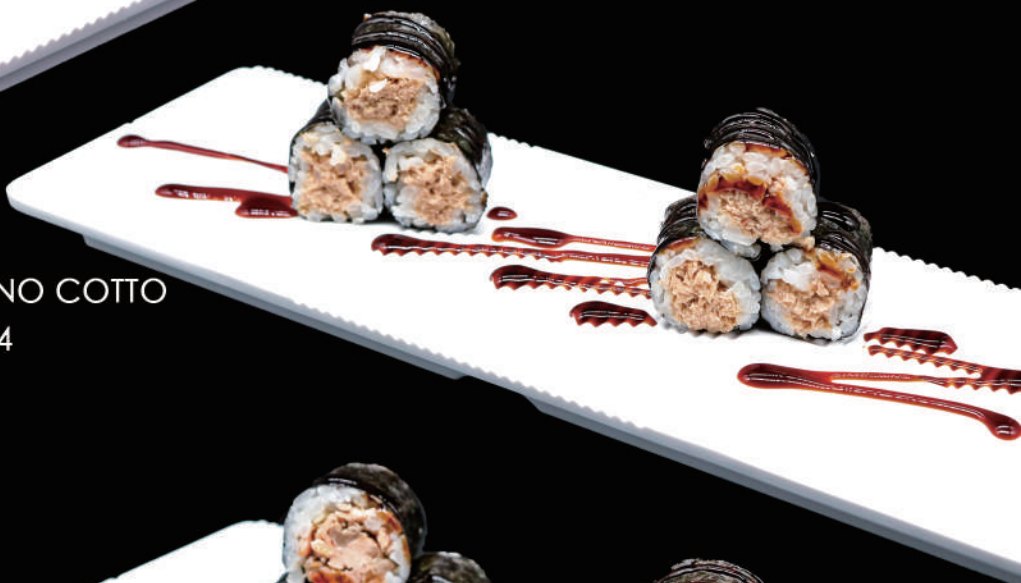
408 - HOSO TONNO COTTO € 6.00 allergeni: 4