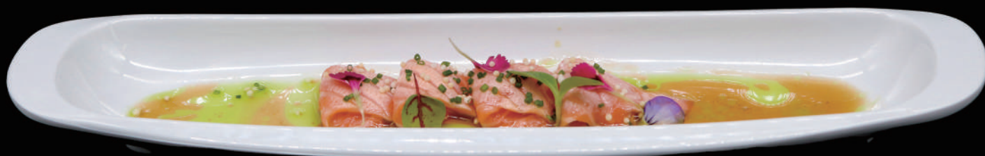
060 - CARPACCIO FLAMBE S 4PZ € 9.00 allergeni: 4