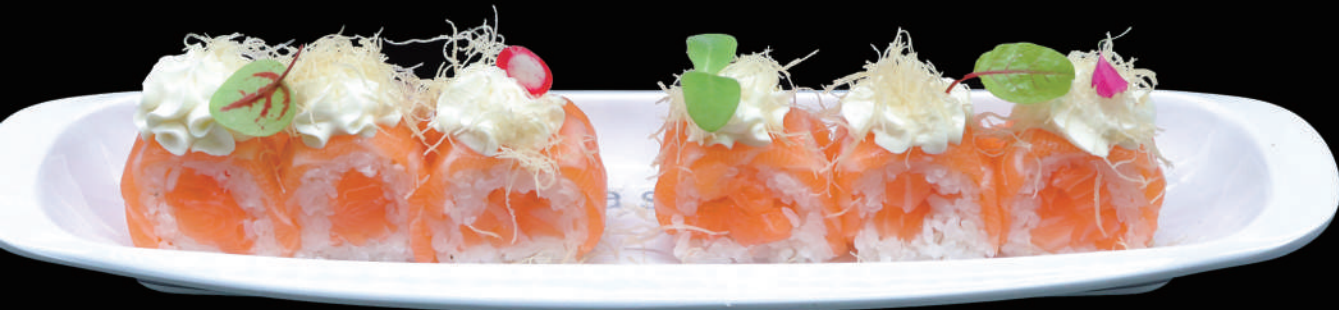
517 - URA. SALMON FRESH 6PZ € 10.00 allergeni: 4, 7