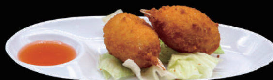
008 - CHELE DI GRANCHIO 3PZ € 5.00 allergeni: 1