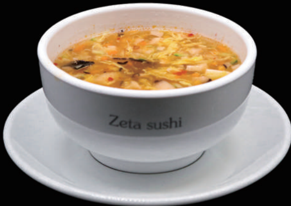
038 - ZUPPA AGROPICCANTE € 5.00