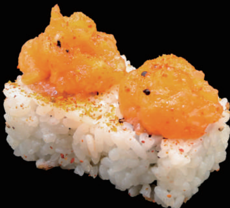
505 - URA. SPICY SALMON € 12.00 allergeni: 1, 4, 11