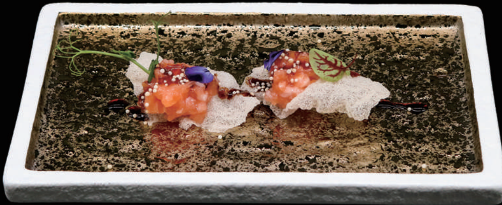
114 - CLOUD SAKE 2PZ € 7.00 allergeni: 1, 2, 4, 6, 7