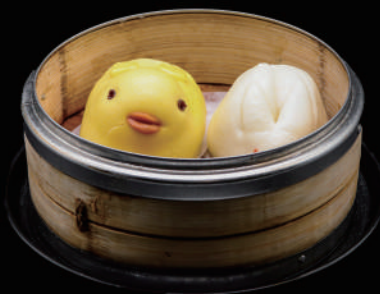
012 - PANE DOLCE 2PZ € 3.50