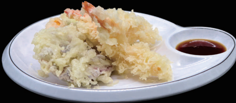
177 - MORIAWASE TEMPURA 7PZ € 6.00 allergeni: 1, 2