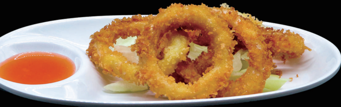
183 - CALAMARO FRITTO 4PZ € 6.00 allergeni: 1, 4