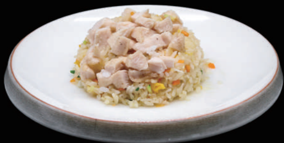
129 - RISO POLLO € 7.00