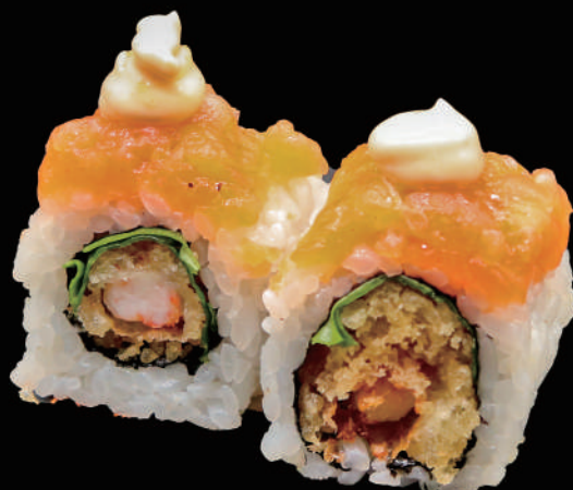
525 - URA. SPICY SALMON PLUS € 12.00 allergeni: 1, 2, 3, 4, 6