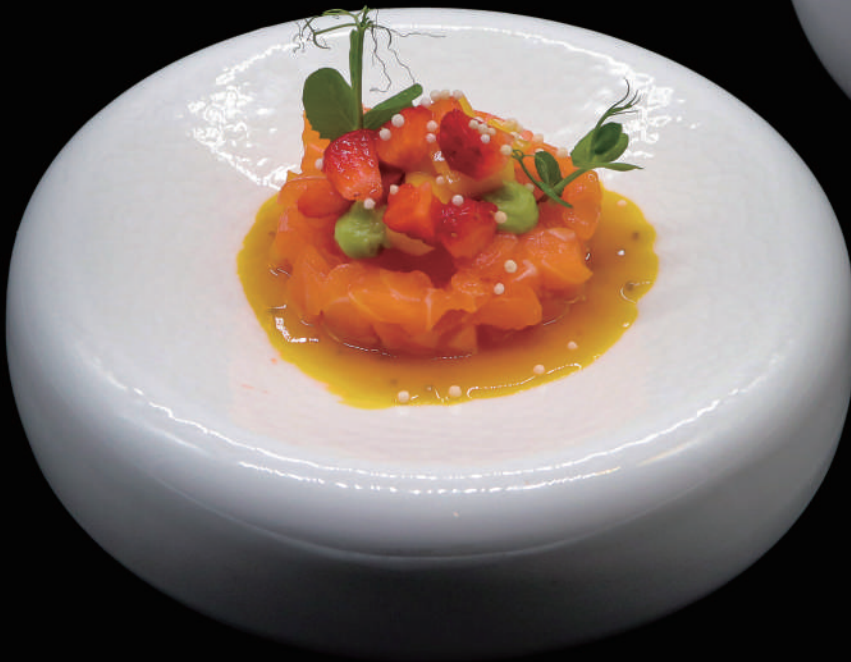
071.- ESOTIC TARTARE € 10.00 allergeni: 4