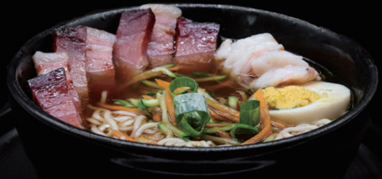
145 - ZETA RAMEN € 9.00 allergeni: 2