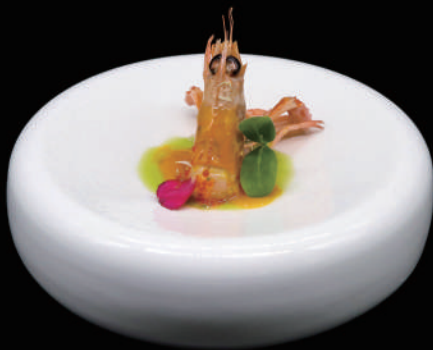
255 - SASHIMI SCAMPO 2PZ € 8.00 allergeni: 2