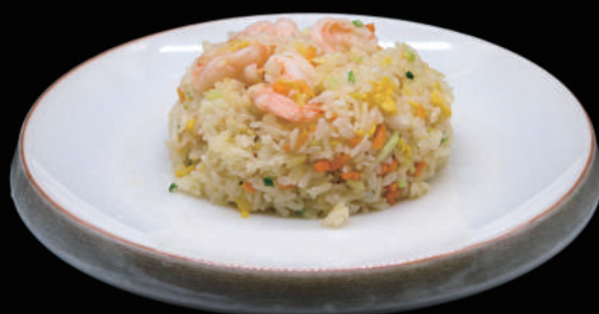
128 - RISO GAMBERI € 7.00 allergeni: 4