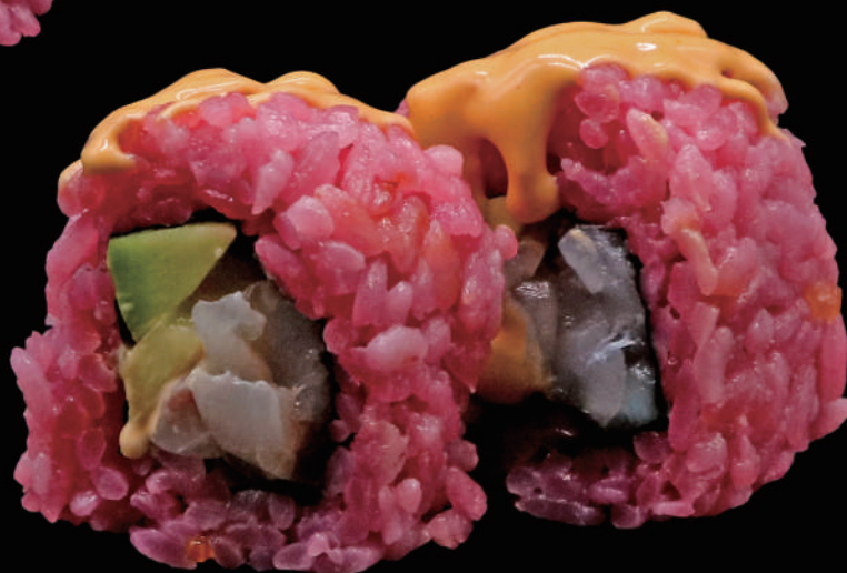
564 - ROSE WHITE € 14.00 allergeni: 4